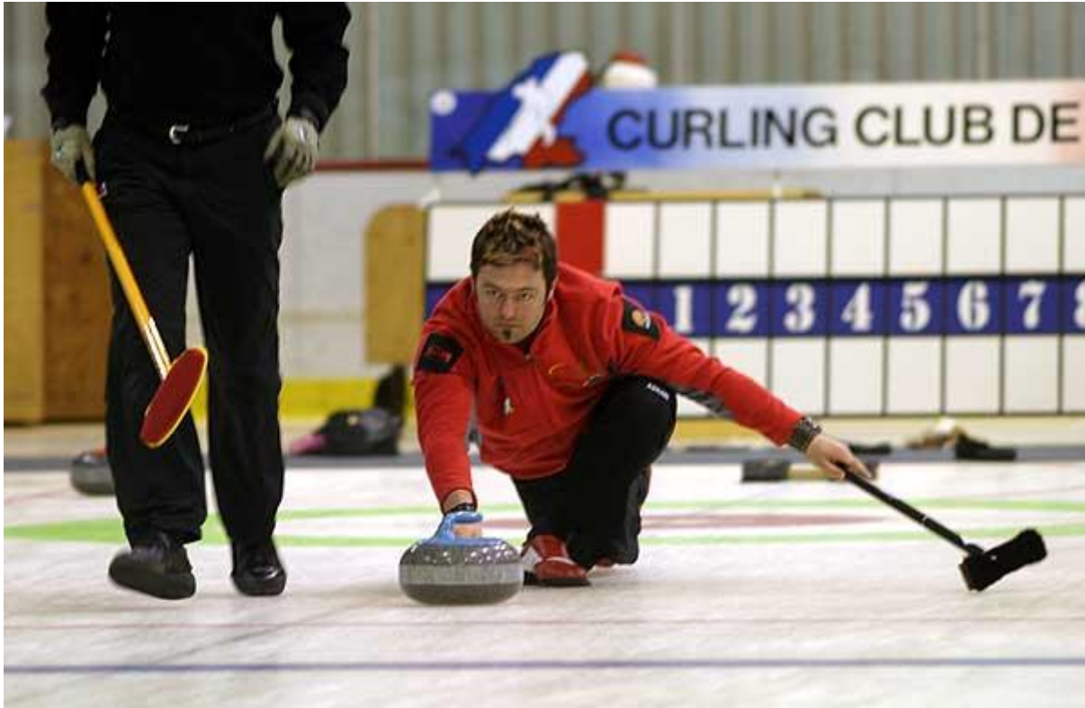
Jamie Korab, vainqueur du Tournoi de Saint-Pierre

Il s'est déroulé le week-end dernier et a réuni 14 équipes. La victoire revient à une équipe de Saint-Jean de Terre Neuve skippee par Jamie Korab, champion olympique à Turin en 2006.